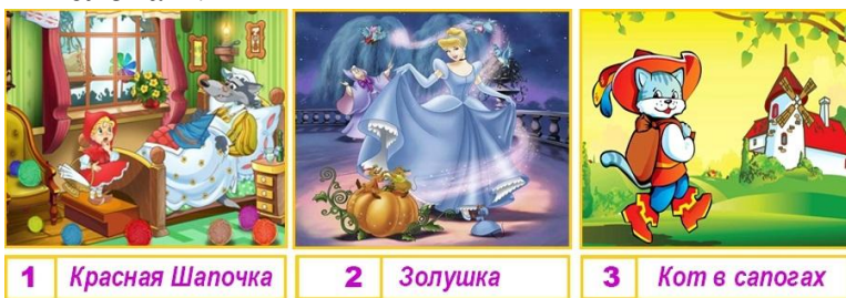
1 Красная Шапочка

В какой из этих сказок уделено внимание всем этим словам?