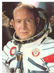
2. ЛЕОНОВ АЛЕКСЕЙ