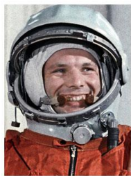
1. ГАГАРИН ЮРИЙ

Найди на картинке космонавта, который 12 апреля 1961 года совершил первый в истории человечества космический полёт.