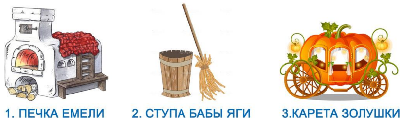
1. ПЕЧКА ЕМЕЛИ

Найди среди них предмет, попавший сюда случайно из иноземного государства.