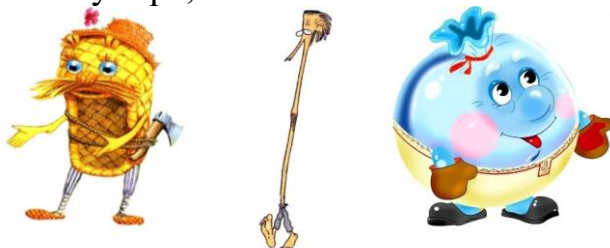
1. Лапоть 2. Соломинка 3. Пузырь

Для выполнения этого задания тебе понадобится зеркальце. Подойди к зеркалу и втяни щёки. Какого героя из сказки «Пузырь, соломинка и лапоть» можно так изобразить?