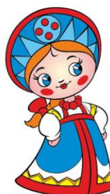
1. Василиса Премудрая

В ответе укажи только номер выбранного варианта (1 или 2 или 3)