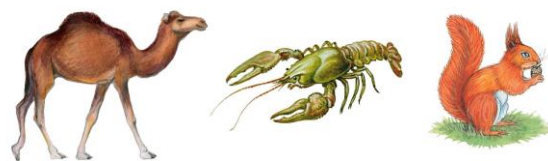
А. Верблюд Б. Рак В. Белка