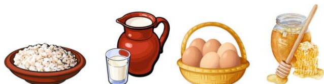
1. Творог 2. Молоко 3. Яйца 4. Мёд

Найди закономерность. Догадайся, что должно стоять вместо вопросительного знака.