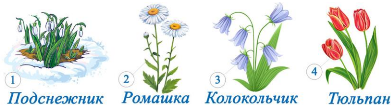
1. Подснежник 2. Ромашка 3. Колокольчик 4. Тюльпан

Это самый первый весенний цветок, который появляется сразу после таяния снега. Найди его на картинке!