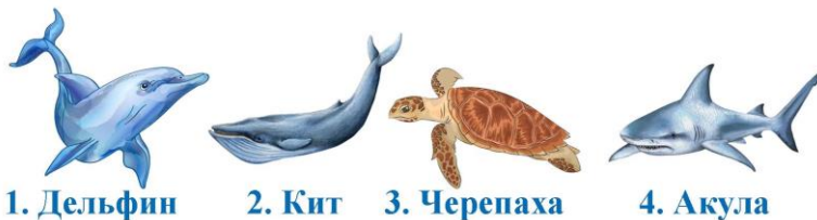
1. Дельфин 2. Кит 3. Черепаха 4. Акула

Найди на картинке животное, которое может жить как на суше, так и в воде.