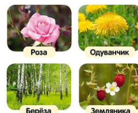
Роза Одуванчик Берёза Земляника

В ответе запиши название одного из пяти «царств» живой природы