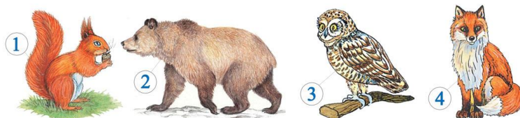
1. Белка 2. Медведь 3. Сова 4. Лиса

Какой зверь зимует в берлоге и просыпается весной? Найди на картинке этого засоню!