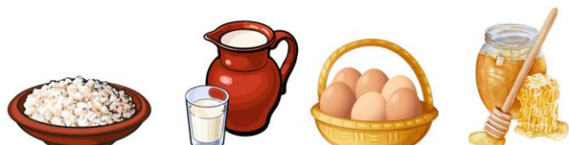
1. Творог 2. Молоко 3. Яйца 4. Мёд

Найди закономерность. Догадайся, что должно стоять вместо вопросительного знака.