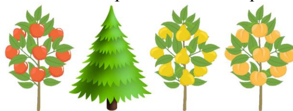
1. ЯБЛОНЯ 2. ЕЛЬ 3. ГРУША 4. ПЕРСИК

У трёх деревьев на картинке есть общий признак. Какое дерево лишнее в этом ряду?