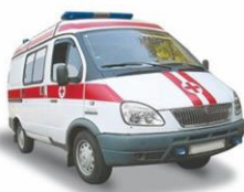
2 СКОРАЯ ПОМОЩЬ