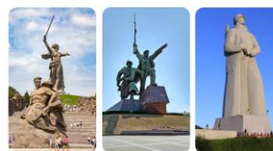
1) Волгоград 2) Севастополь 3) Мурманск

Стоит над Чёрным морем город-герой. Его легко найти на карте почти на самом юге Крымского полуострова. О каком городе-герое этот вопрос?