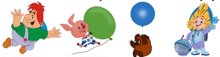
1. КАРЛСОН 2. ПЯТАЧОК 3. ВИННИ-ПУХ 4. НЕЗНАЙКА

Кто из этих сказочных персонажей летал на Луну?