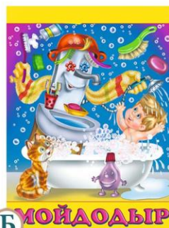
Б МОЙДОДЫР «Мойдодыр»