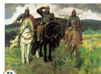
В Картина «Богатыри»