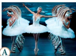
А Балет «Лебединое озеро»