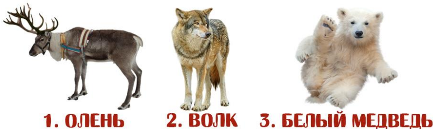
1. ОЛЕНЬ 2. ВОЛК 3. БЕЛЫЙ МЕДВЕДЬ

Я – один из самых крупных хищников в мире. Заметить меня издали очень нелегко – белая шерсть почти не видна среди снега и льдов. А обнаружить меня можно лишь по чёрному кончику носа. Кто я?