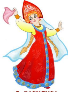
3. ВАСИЛИСА ПРЕМУДРАЯ

В ответе укажи только номер выбранного варианта (1 или 2 или 3)