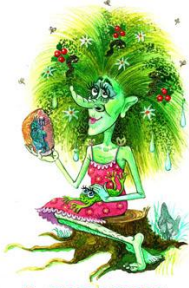
2. КИКИМОРА БОЛОТНАЯ