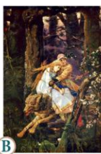
В «Иван-царевич на Сером Волке»