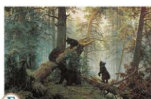
Б «Утро в сосновом лесу»