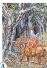
А «Илья Муромец и Соловей-разбойник»