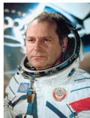
3. ТИТОВ ГЕРМАН

В ответе укажи только номер выбранного варианта (1 или 2 или 3)